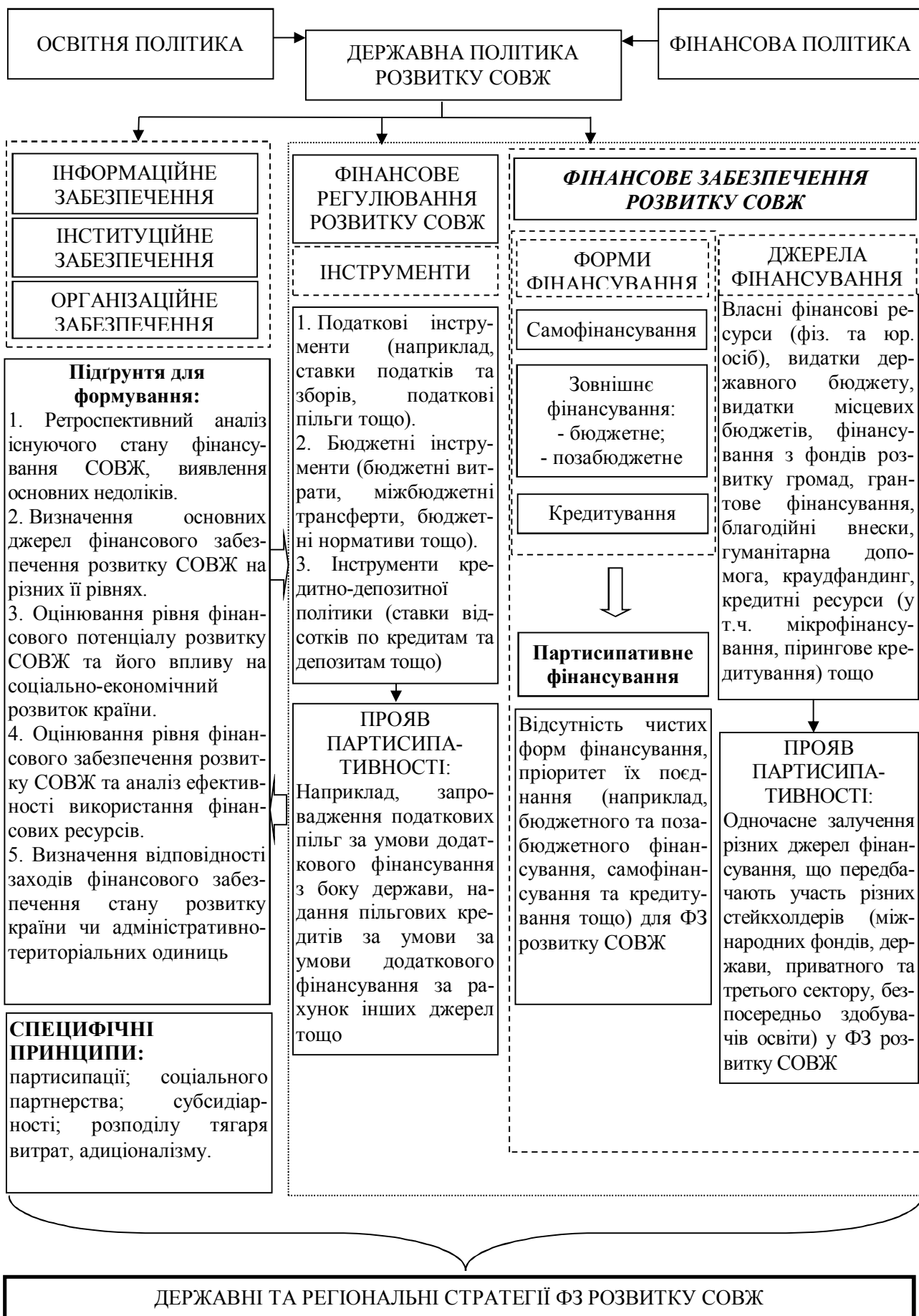
Рис. 2 – Концептуальні засади партисипативного державного регулювання розвитку СОВЖ